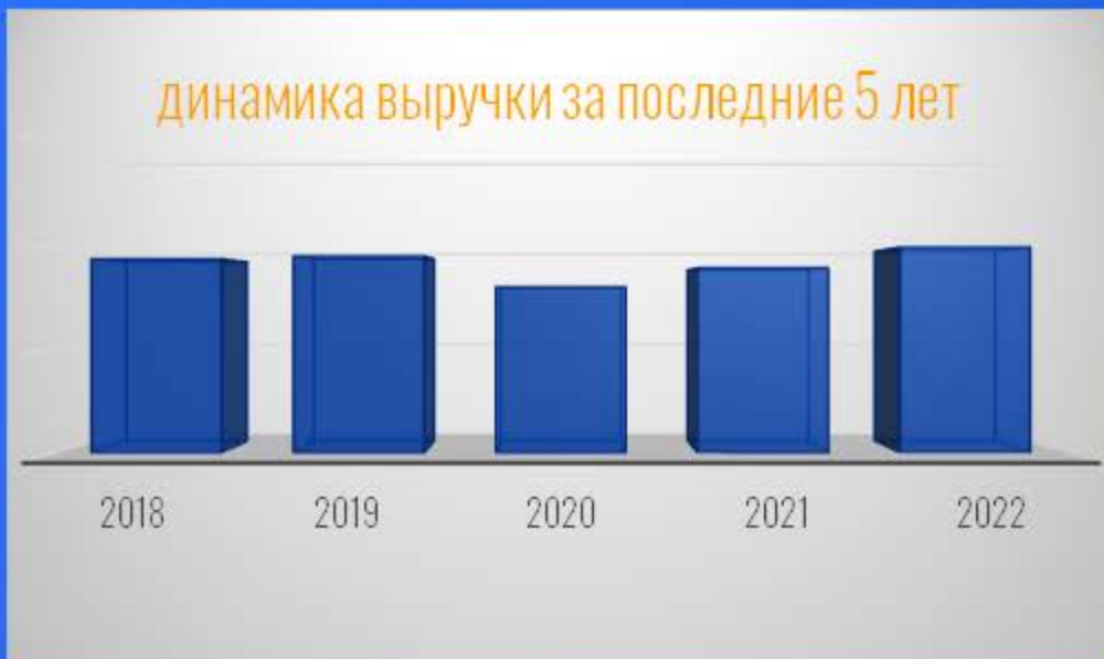
динамика выручки за последние 5 лет

Лидер Урала и Западной Сибири в налоговом консалтинге. Входит в 30 крупнейших аудиторско-консалтинговых групп России*